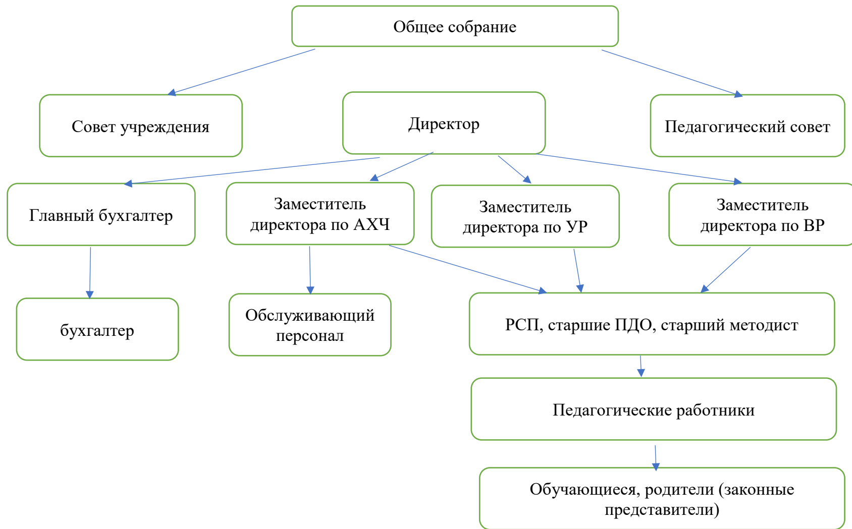
Рисунок 1 - Структура управления МБУДО «ЦВР г. Челябинска»