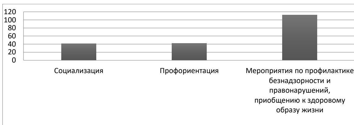
Рисунок 4 – Направленность познавательных и профилактических мероприятий в рамках инновационного проекта (2021 год).

Обучающие образовательных организаций Курчатовского района и МБУДО «ЦВР г. Челябинска» приняли участие в следующих мероприятиях: