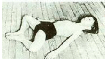
Рисунок 2 Поза "Бабочка"