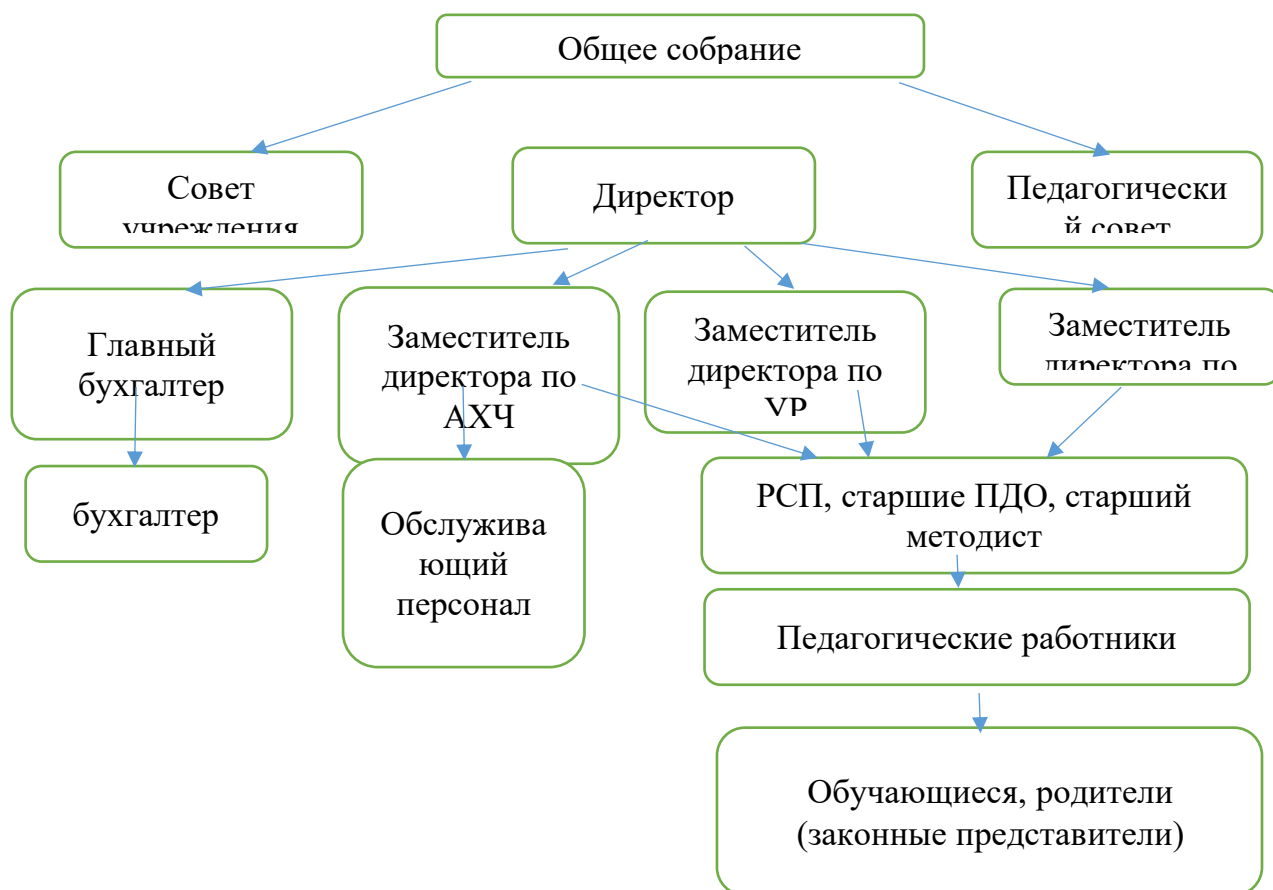
Рисунок 1 - Структура управления МБУДО «ЦВР г. Челябинска»

Образовательный процесс осуществляется в 23 благоустроенных, оснащенных современной мебелью учебных кабинетах.